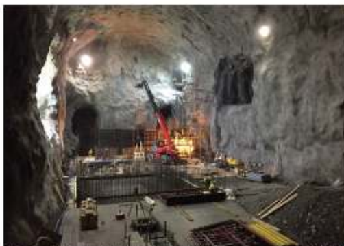
Skillevik utbygging av et nytt vannverk. ©Baker for arkitektur med 3D-animasjon av 3D-modellering.

Tilstandsvurdering av kommunale vann- og avløpstjenester